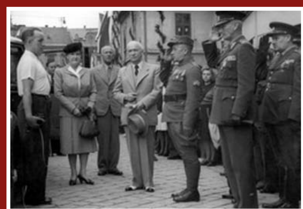
Návštěva Edvarda Beneše ve Vyškově