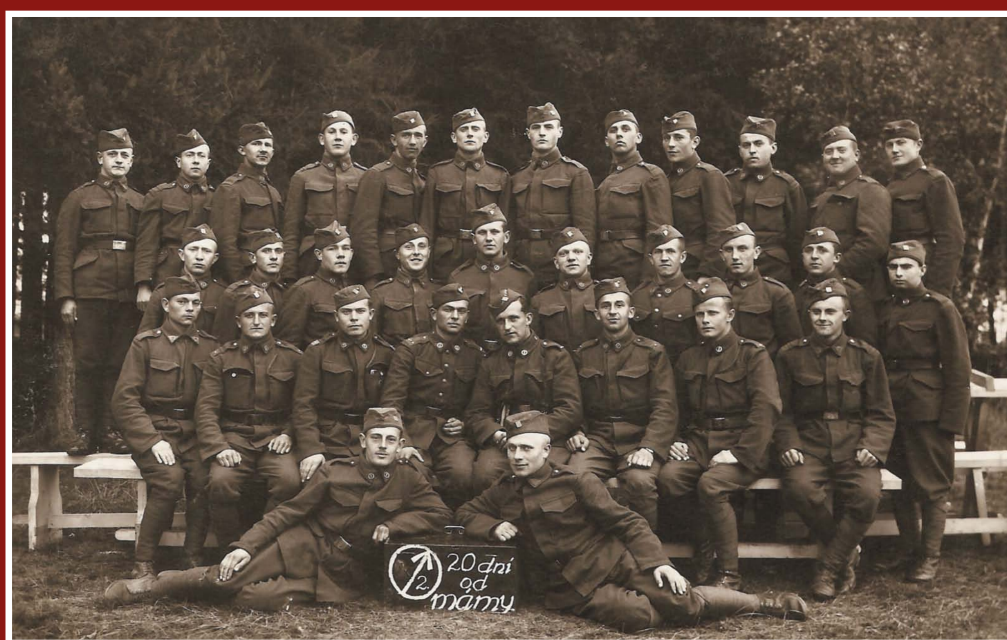
Nováčky v PUV2 po dvaceti dnech vojny