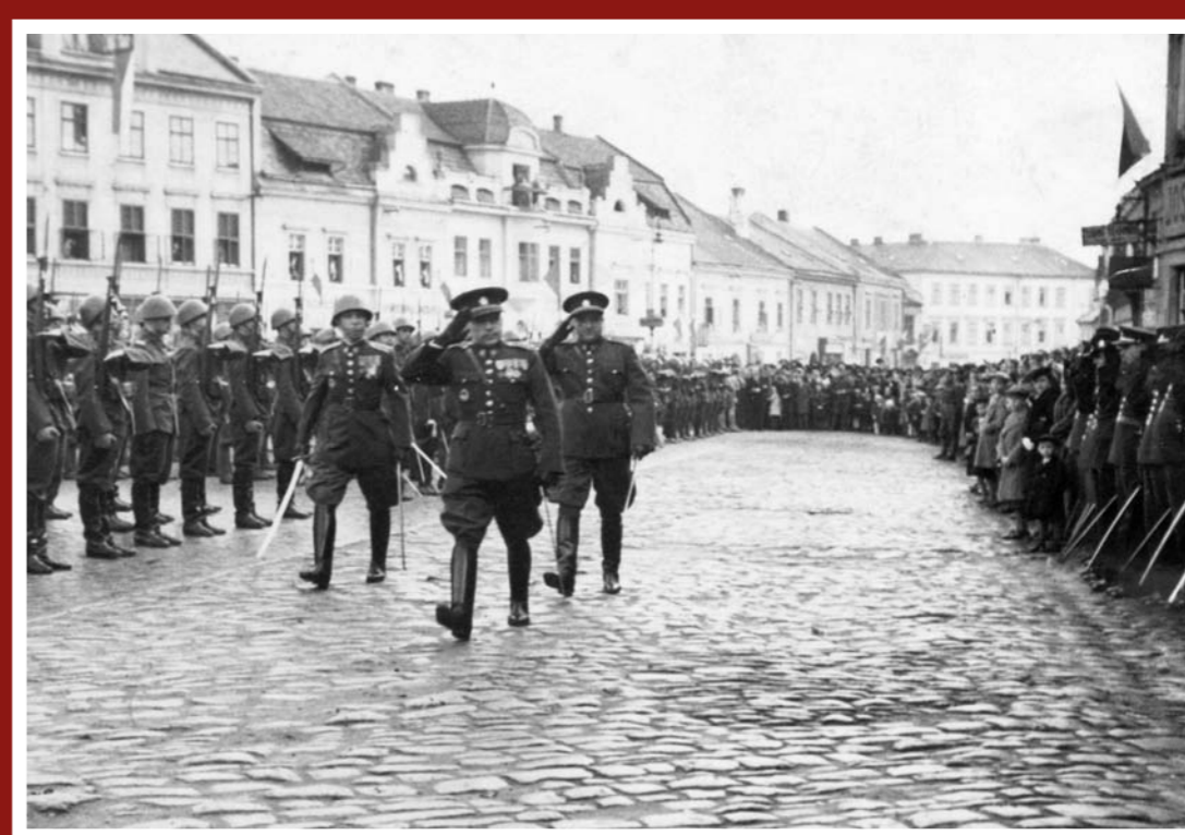
Vitání 2. pluku útočné vozby ve Vyškově, zřejmě 28. října 1936