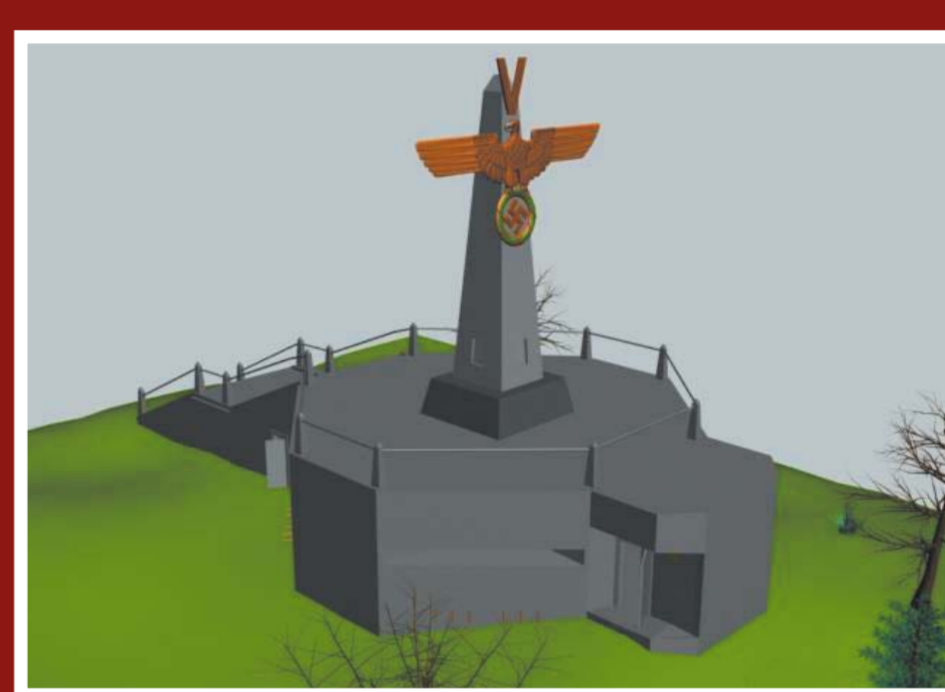
Mohyla Vítězná – 3D model předpokládané podoby

Německá armáda prováděla ve vojenském prostoru velmi intenzivní vojenský výcvik; dle pamětníků zde byly cvičeny i jednotky, které bojovaly o Stalingrad. Pro zdůraznění vojenské převahy a pro zvěčnění dosažených vojenských úspěchů bylo započato se stavbou monumentálního památníku, který měl oslavovat německé vítězství ve druhé světové válce a německou nadvládu nad Evropou. Pro jeho umístění byla vybrána kóta 483,8 Dlouhá Seč nacházející se v jihozápadním cípu střelnice č. 5 Buchtelka. Kopec byl přejmenován na Viktoria Höhe (Výšina Vítězství), z čehož později vznikl i český ekvivalent Vítězná. Mohyla byla asi 15 metrů vysoká, na vrcholu se rozpínala německá orlice, ve spodní části byl umístěn železobetonový bunkr. Byla zde zahajována a ukončována velká vojenská cvičení, při kterých byla zdůrazňována nadvláda německých vojsk a blízké vítězství ve válce. Na stavbu památníku byli údajně nasazeni nejen ruští zajatci, ale pracovali na něm prý i obyvatelé okolních obcí. Stavbu se podařilo dokončit pravděpodobně na přelomu let 1942 a 1943.