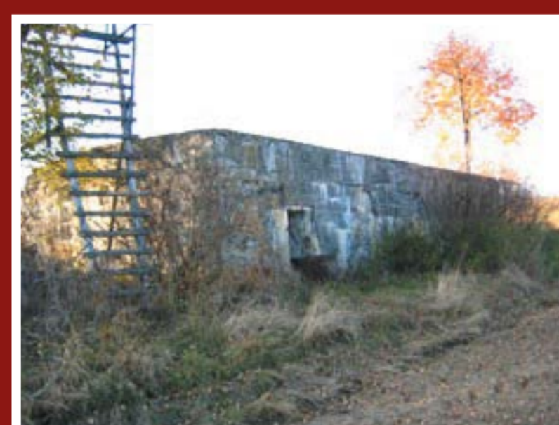
Dvoustranná strojovna s pozorovatelnou – „Škola“