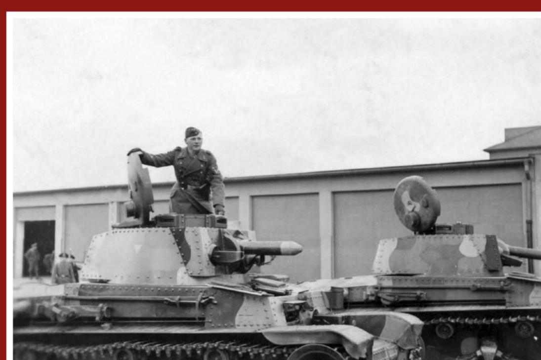
Vyškov 1939 – německý voják Luftwaffe na LT vz. 35 v kasárnách Jana Žižky z Trocnova

Ihned po zabrání zbytku Československé republiky došlo k odevzdání výzbroje a ostatního materiálu vojenské správy německým jednotkám. V případě posádky Vyškov to znamenalo zejména předání LT 35 a dalších vozidel, které se pak již pod novými majiteli účastnili tažení v Polsku i Francii. Posledním místem nasazení tanků LT 35 byl vpád do SSSR, teprve v roce 1943 byly staženy z frontové služby. Také letiště ve Vyškově se stalo místem s novou správou. A samozřejmě i výcvikový prostor.