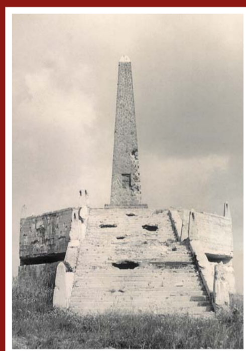
Mohyla Vítězná – podoba po válce a v současnosti

Po skončení války byla Vítězná po nějaký čas normálně využívána jako pozorovatelna, na vrcholu obelisku byla umístěna rudá pěticípá hvězda (zřejmě jako důkaz nové ideové úlohy). I tento symbol byl však časem odstraněn, což zřejmě souviselo s opuštěním objektu a jeho započatou devastací. Správa vojenského prostoru měla snahu památník chránit, 13. listopadu 1963 byl rozhodnutím Školské a kulturní komise ONV ve Vyškově zapsán do státního seznamu nemovitých kulturních památek. „Zbaven fašistické okázalosti stojí dodnes pozůstatek mohyly jako historický důkaz fašistického chvastounství, jako vykřičník pro upomínku a poučení budoucích pokolení.“ (Výtah z článku v časopisu Československý voják z r. 1972.) S nastupujícím obdobím normalizace však začala být stavba trnem v oku tehdejším funkcionářům, Vojenský historický ústav v Praze po projednání s velitelstvím posádky Vyškov projevil negativní stanovisko k zachování památkové ochrany a zřejmě v roce 1975 byla zahájena demolice objektu. Zápis památníku do seznamu nemovitých a kulturních památek byl zrušen až roku 1983.