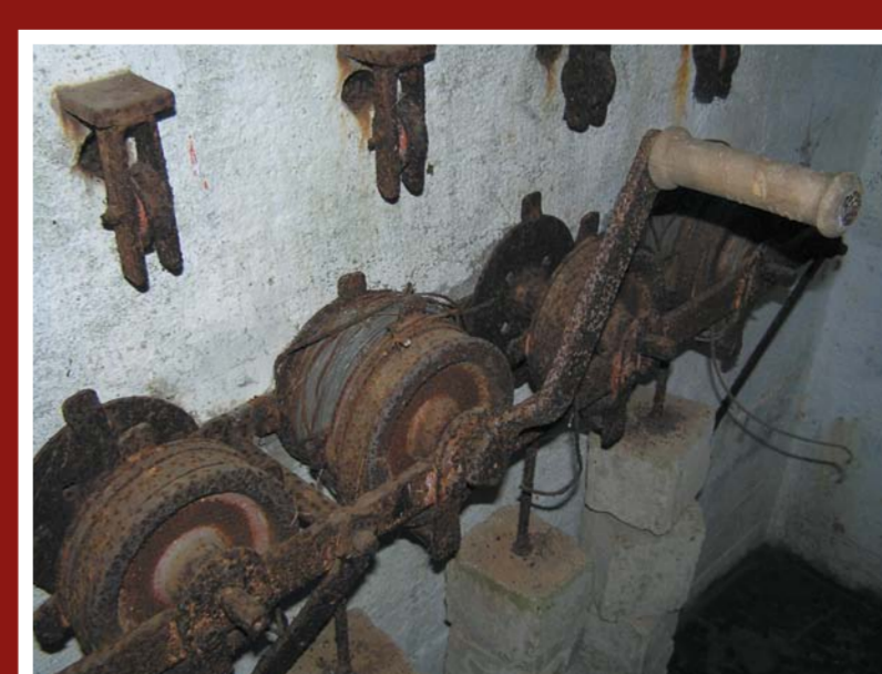
Technické vybavení strojovny – lanové navijáky