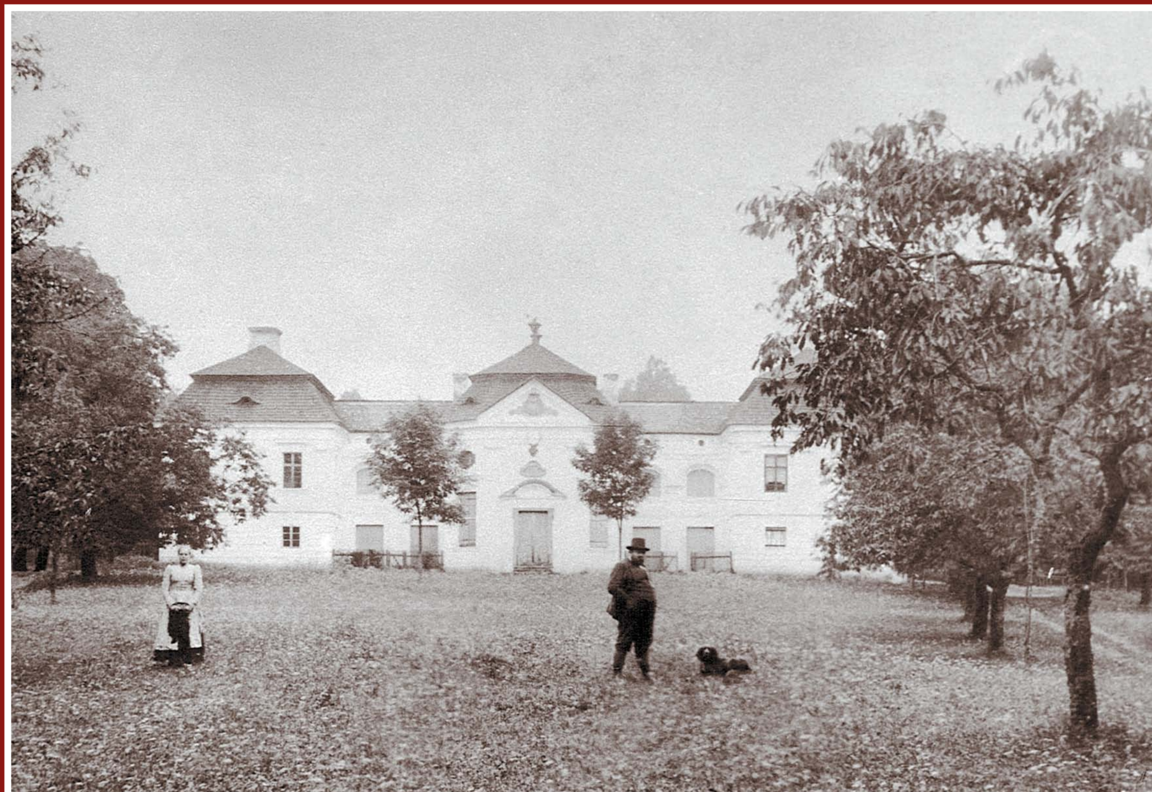
Zámek Ferdinandsko – r. 1914