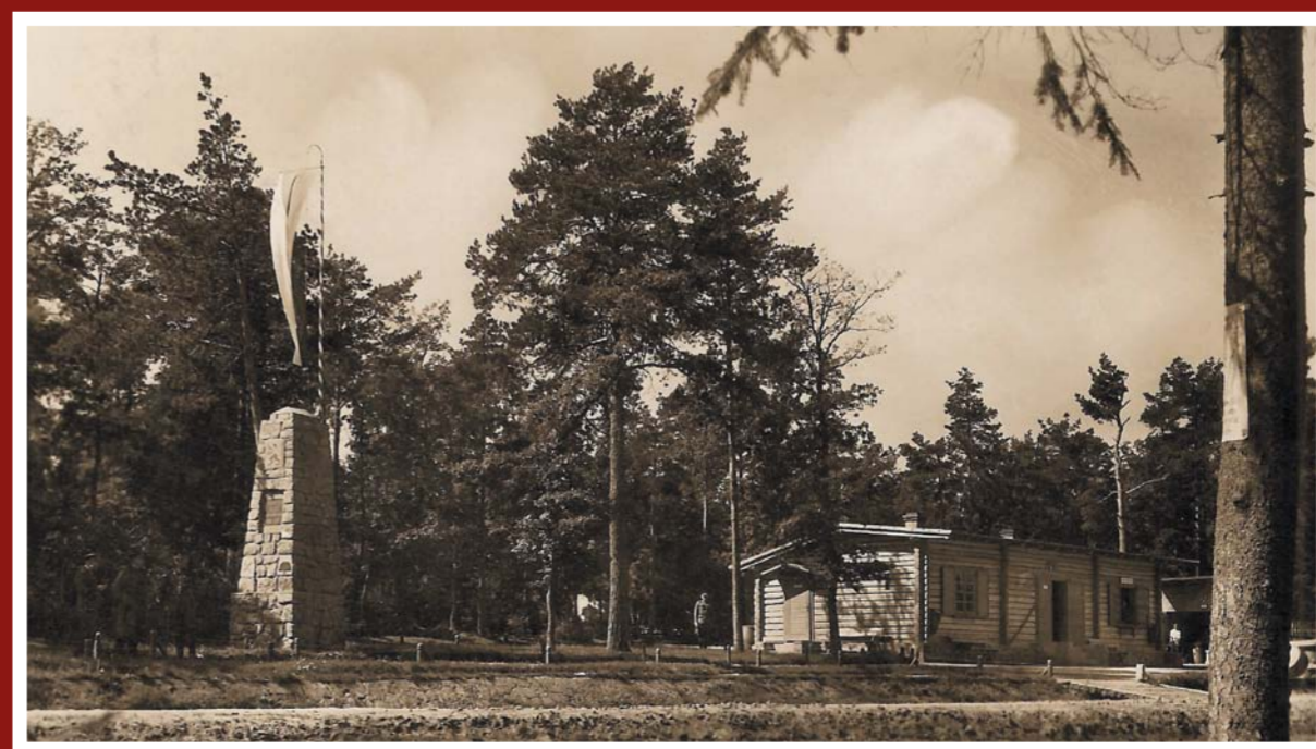
Pěší polní střelnice – r. 1938