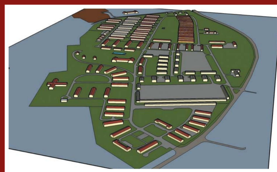
Plánovaná podoba tábora na Kozí Horce

Pro tábor Kozí Horka bylo vybráno návrší nad obcí Dědice, kde se do té doby nacházela úzká políčka obhospodařovaná místními sedláky. Vřetenovitě tvarovaný prostor byl jasně vymezen svahem údolí Velké Hané od JZ a komunikací, která odbočovala ze silnice Dědice–Radslavice a směřovala přes Vešperk a sv. Annu na Ferdinandsko. Tábořiště bylo původně proponováno pro 2 pluky, 3 300 lidí, 200 koní, jeden dělostřelecký oddíl. Není nám známo, kdy bylo započato s výstavbou tábora. Vodítkem však může být zmínka o nákupu 21 železných koster z Vítkovických železáren určených pro výstavbu montovatelných baráků tábořiště ve Vyškově, která je uvedena v dokumentech pocházejících z bývalé síně tradic na záměčku Ferdinandsko. Tato zmínka je datována do dubna 1938, z čehož lze usuzovat, že výstavba tábora byla započata ještě před okupací naší republiky.