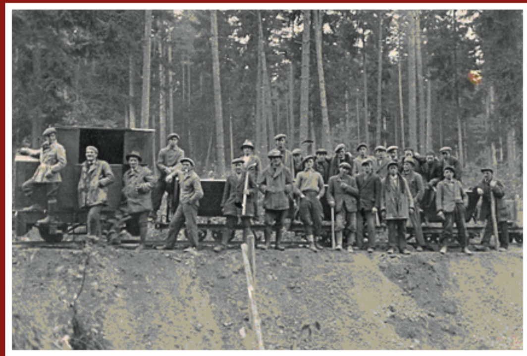
Dělníci s úzkorozchodným vláčkem užívaným na Vedralce, dle sdělení pamětníka (čtvrtý zleva za lokomotivou) však již na staveništi Eichlerky (?)

Období vzniku vojenského výcvikového tábora v Dědicích a jeho několikaletá existence v posledních chvílích předválečného Československa je stále obestřeno mnoha záhadami a nejasnostmi. Důvodů je možno vyslovit několik, nejpádnejším se však jeví být velký stupeň utajení, kterému podléhala veškerá výstavba infrastruktury budoucích cvičišť. Dobové dokumenty dotčených okresních úřadů tento fakt plně potvrzují, dochovala se například hlášení o pohybu a zadržení několika podezřelých osob v prostoru vojenského cvičiště.