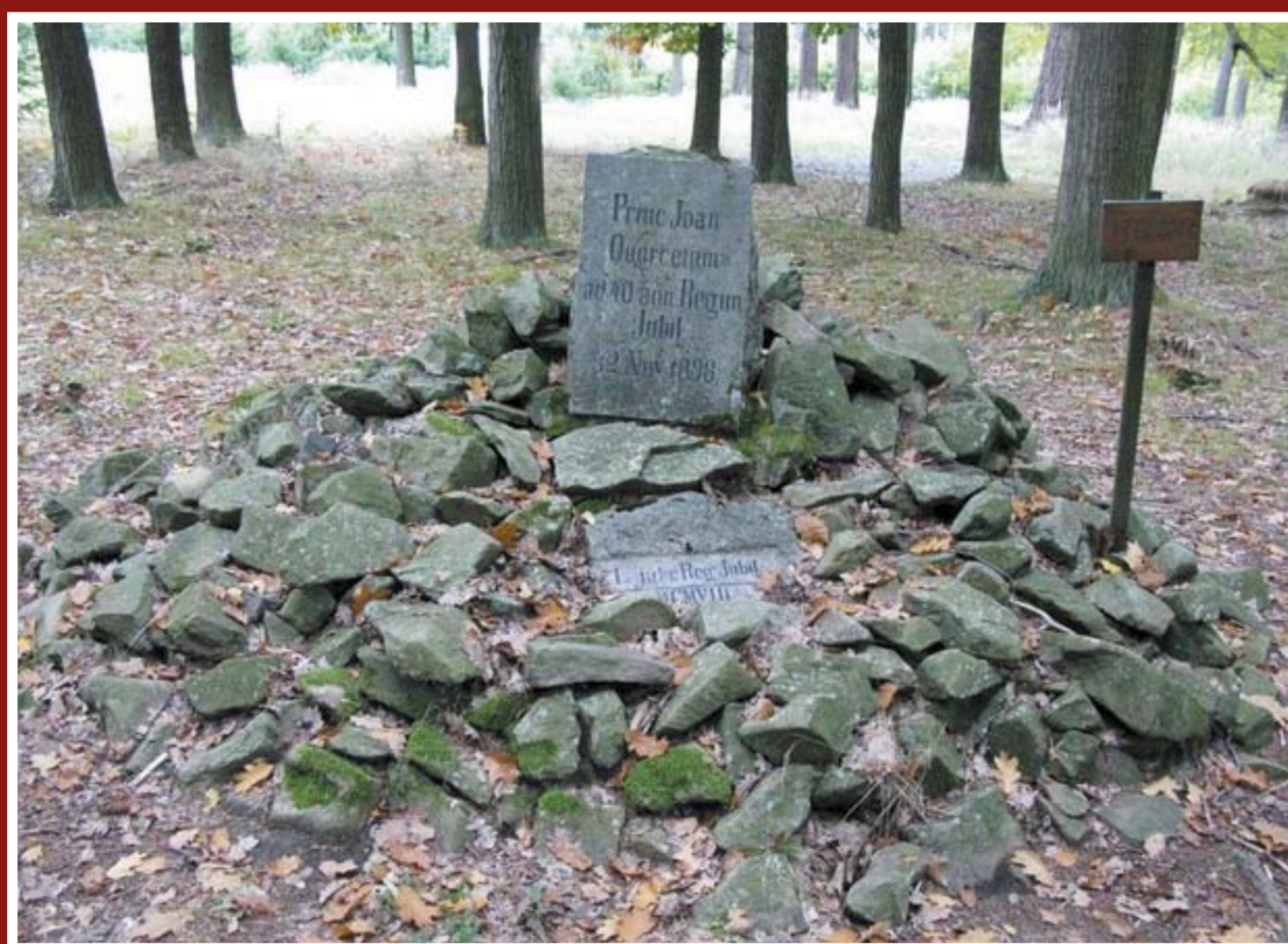
Liechtensteinský pomník u knížecích dubů na plesí Habrůvka