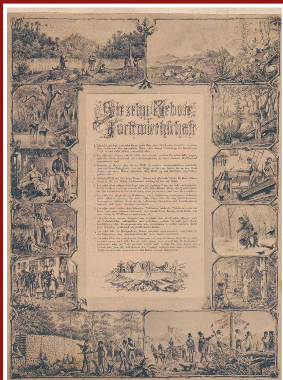
„Desatero přikázání“ pro lesy Ferdinandka a okolí