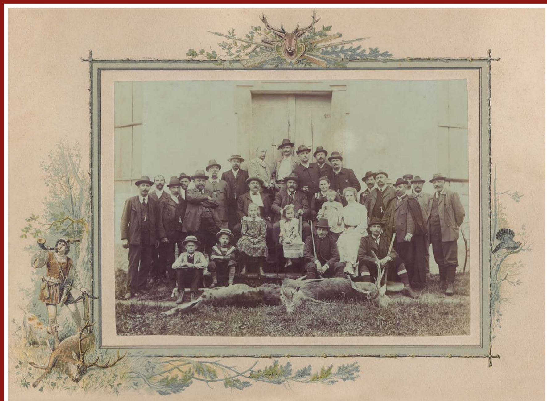
Lovecká společnost na Ferdinandsku – r. 1902