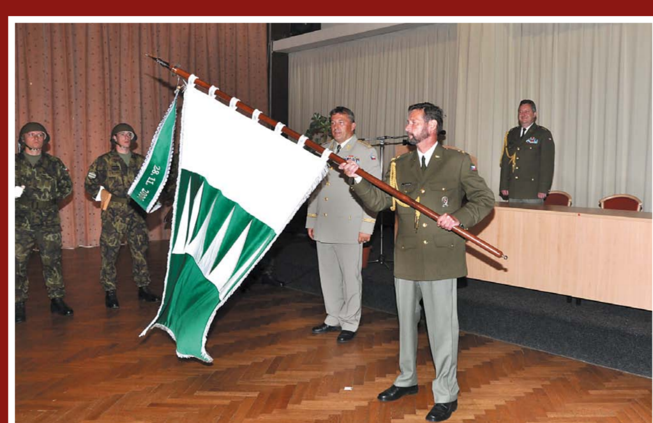
Slavnostní převzetí bojového praporu