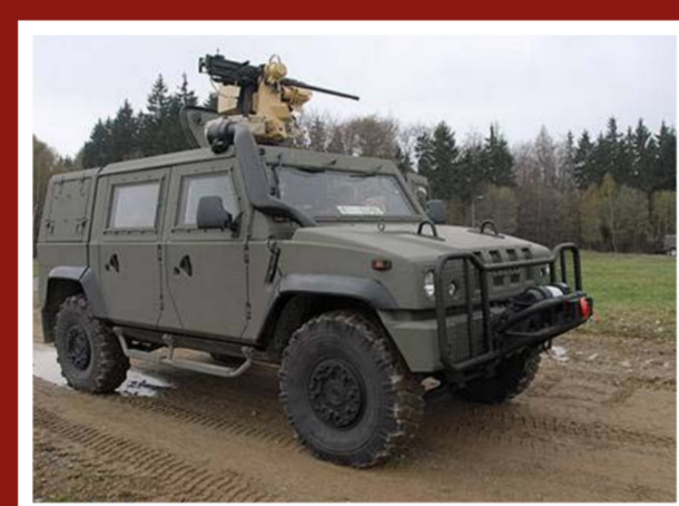
Obrněné vozidlo Iveco