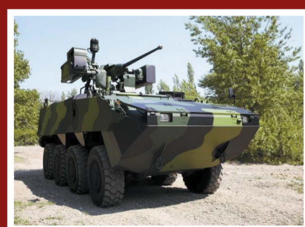
Kolový obrněný transportér Pandur II