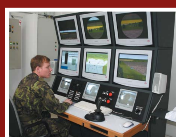
Centrum simulačních a trenažerových technologií

Když se podíváme zpět až na začátek do roku 1935, kdy vznikl výcvikový prostor, je zde stále v používání prostor Úpaly, první stavba používaná již před II. světovou válkou. Zámeček Ferdinandsko, který byl sídlem velitelství až do roku 2005, je nyní prázdný a čeká na další využití. Ale naše výstava by nebyla úplná, kdybychom nezmínili: