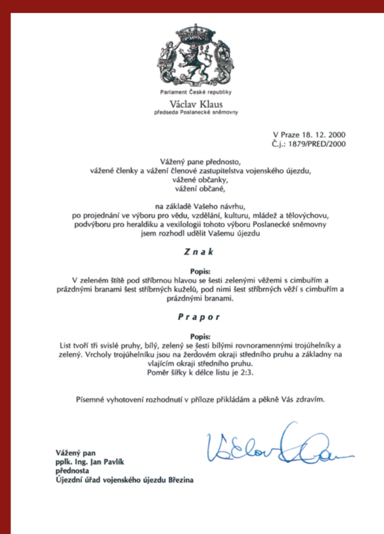
Udělovací dopis předsedy Poslanecké sněmovny