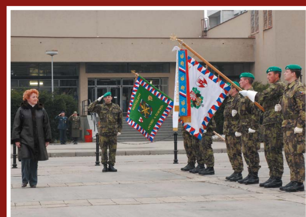
Návštěva ministryně obrany v Ředitelství výcviku a doktrín

I mnoho dalších útvarů a zařízení dislokovaných v posádce Vyškov, navíc do své podřízenosti přebírá dnem 1. 12. 2003 Výcvikové středisko vzdušných sil v Přerově. Cílem těchto změn je přesunout do posádky Vyškov výcvik ze všech výcvikových středisek po celé ČR. Výcvikové středisko vzdušných sil je přestěhováno v roce 2008. Prvním velitelem ředitelství je brig. gen. Ing. Jiří Halaška.