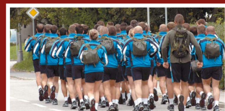
Výcvik základní přípravy