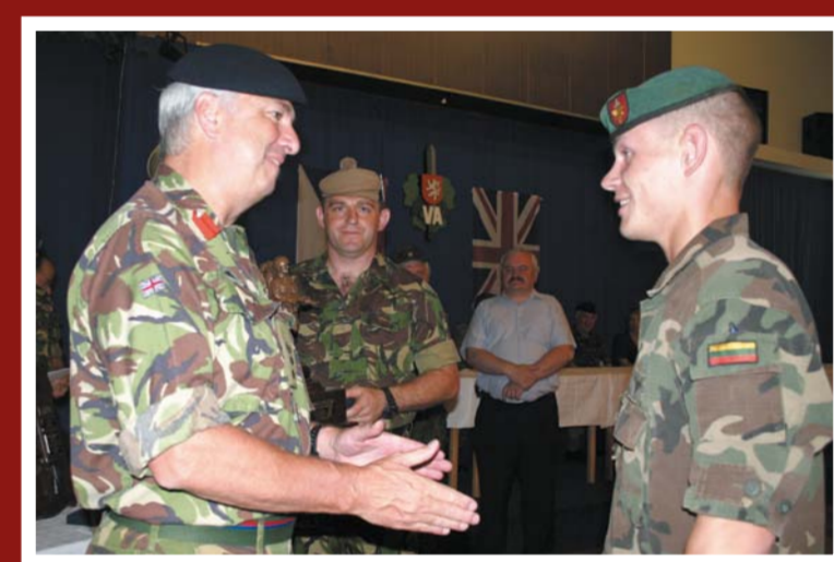
BMATT – slavnostní vyřazení absolventů

Spolupracuje nově s Texaskou národní gardou (2004). Také organizuje nové typy výcviku a kurzů, např. pro Rakouskou armádu (chemické odbornosti). Další úkol, který je třeba řešit, je výcvik diplomatického sboru a novinářů před nasazením do krizových oblastí. Novými úkoly jsou v roce 2008 také kurzy civilních zaměstnanců ze struktur NATO. Také je zde další potřeba po zrušení výcvikového střediska mírových sil v Českém Krumlově – převzít odpovědnost za přípravu vojáků vysílaných do zahraničních misí. A navíc převzetí vzdělávání odborností vzdušných sil, když dojde k rozhodnutí přestěhovat výcvikové středisko vzdušných sil z posádky Přerov do Vyškova (2008).