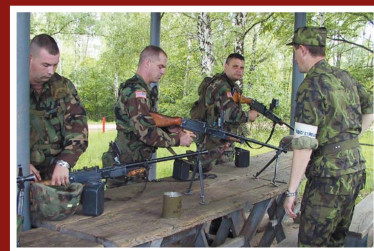
Výcvik Texaské národní gardy