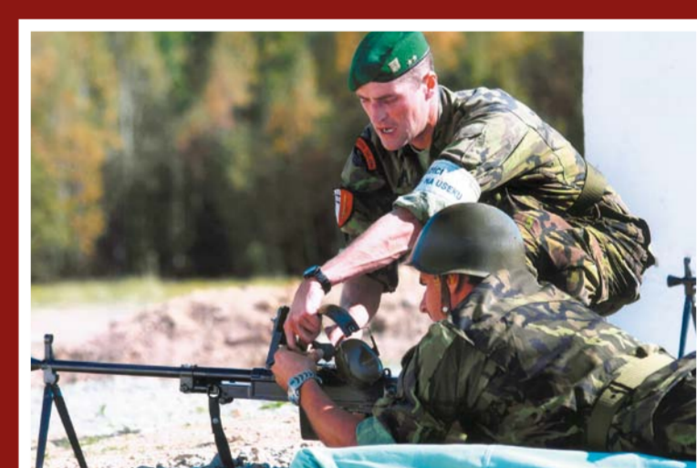
Výcvik na pěší střelnici