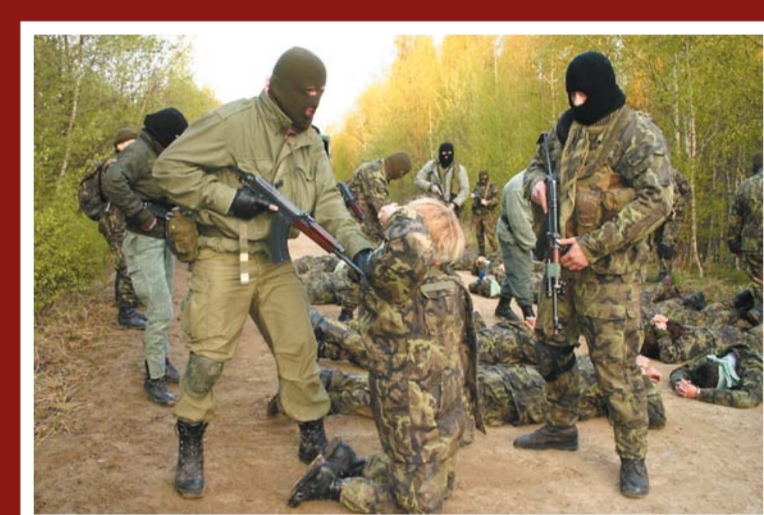
Kurz civilních zaměstnanců NATO