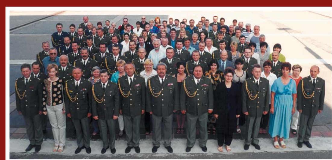
Pracovníci Vojenské střední školy – r. 2002