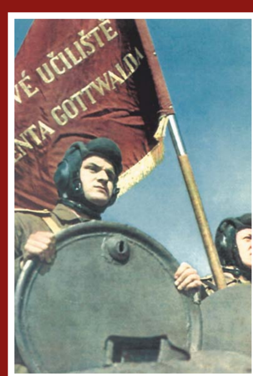
Odznak a nová bojová zástava Tankového učiliště Klementa Gottwalda v Dědicích z roku 1952