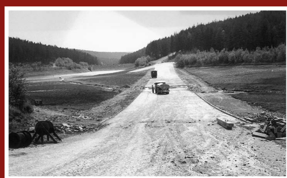
Zpevňování hrází přehrady Myslejovice