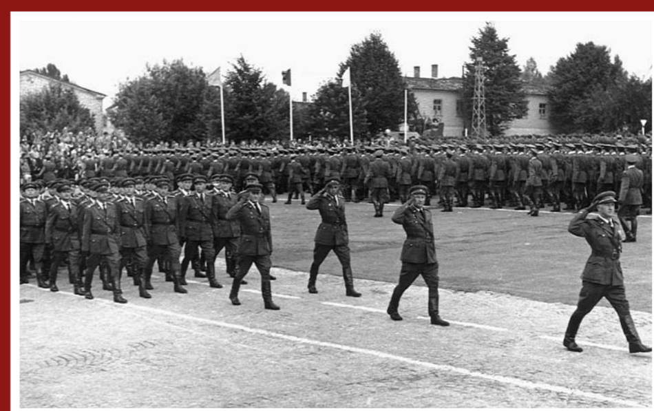
Vyřazení absolventů Vojenského učiliště – r. 1961