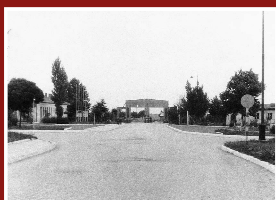
Hlavní vstup do Tankového učiliště Klementa Gottwalda – r. 1952