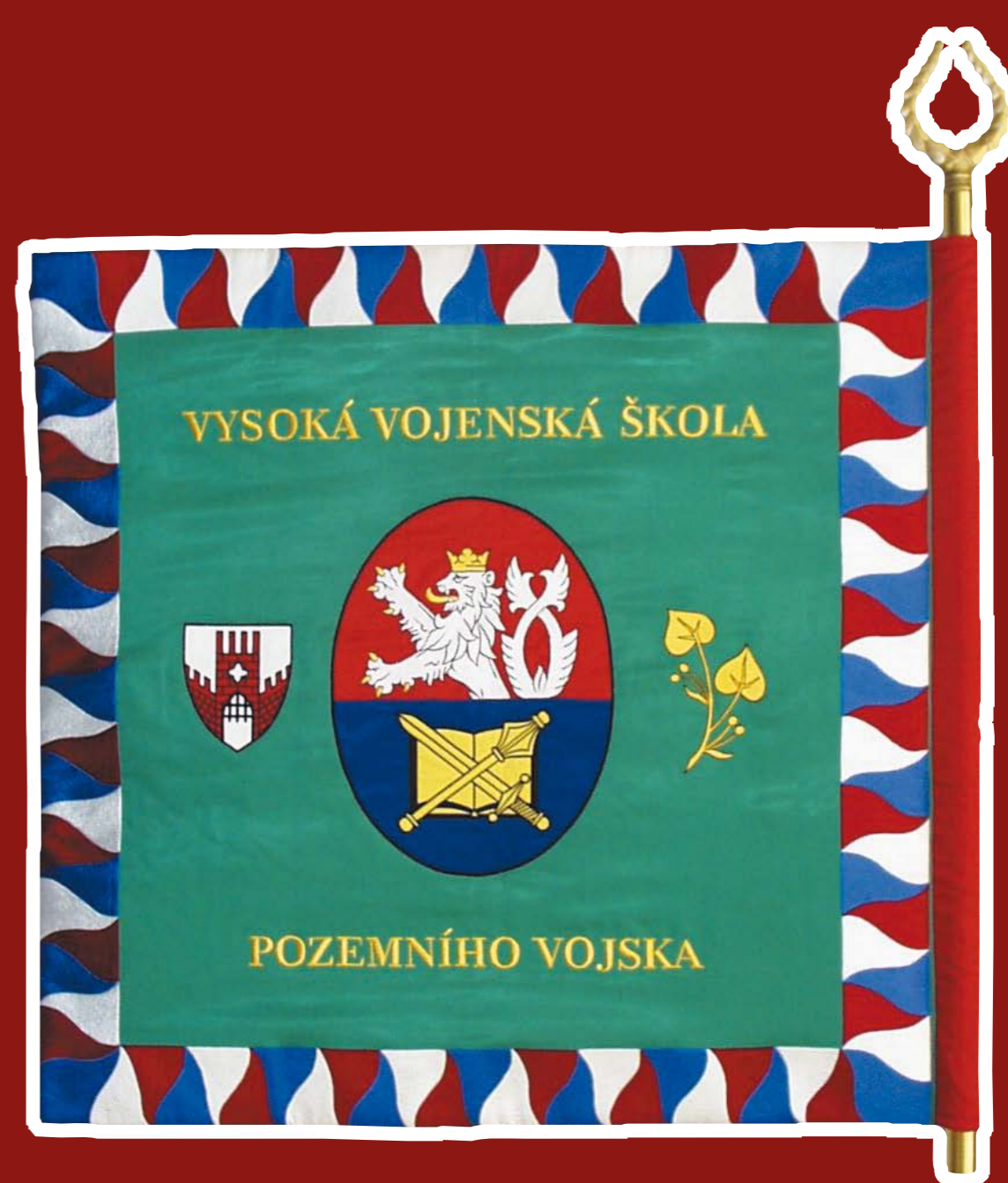
Bojová zástava VVŠ PV