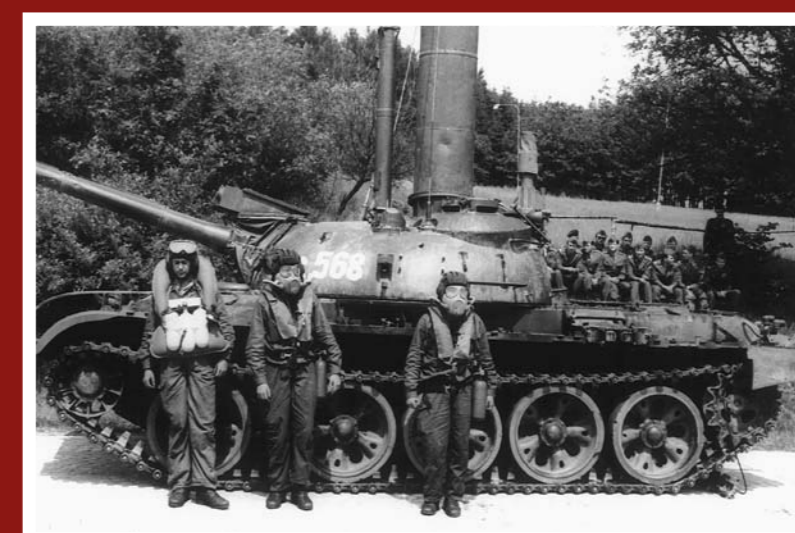
Výcvik studentů v jízdě T-55AM2 pod vodou