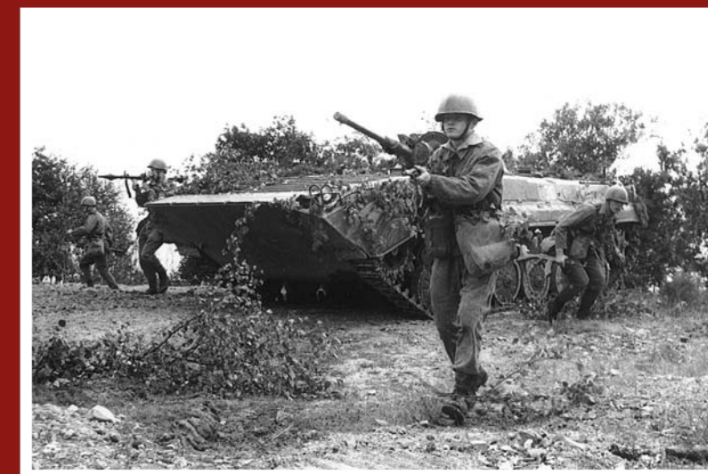
Rotní taktické cvičení s bojovou střelbou