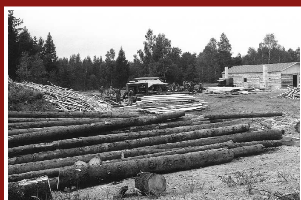
Výstavba srubového tábora – r. 1988