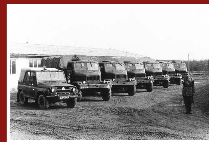
Řidičské cvičiště Vešperk