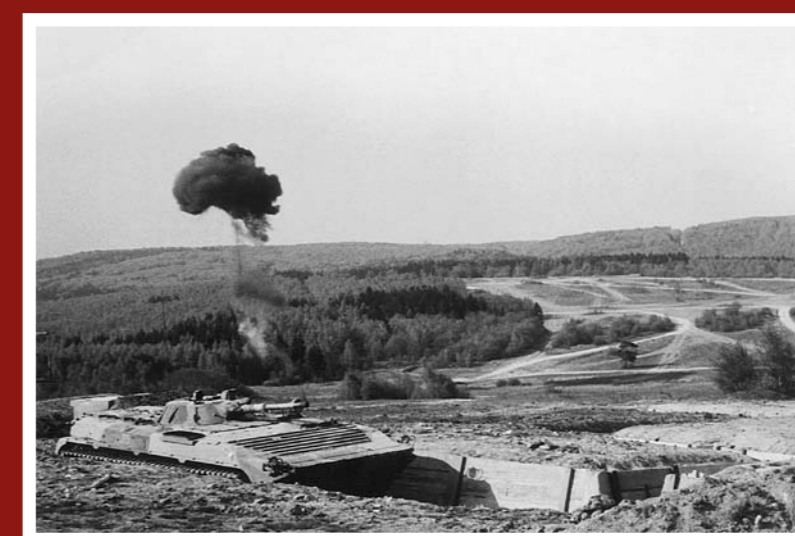
Rotní taktické cvičení BVP-1