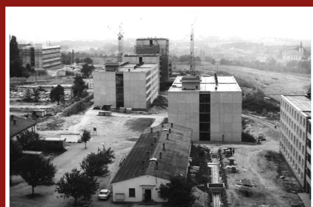
Stará zástavba ustupuje novým objektům Vysoké vojenské školy – r. 1975