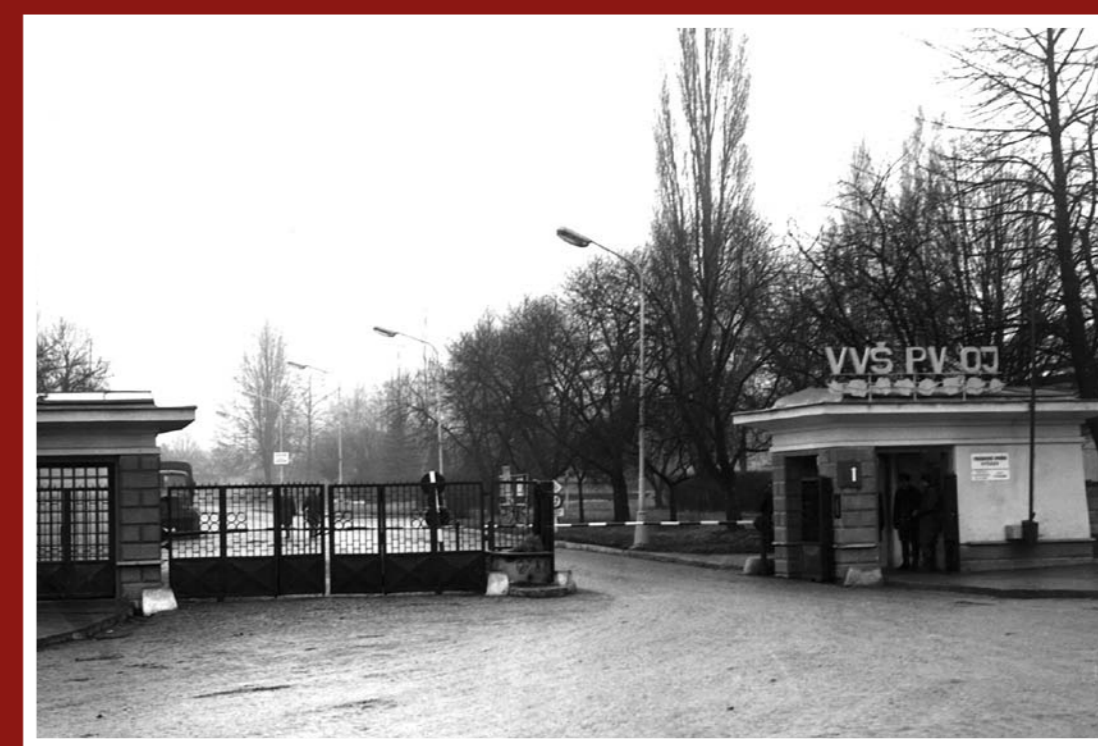
Čelní pohled na hlavní bránu a vstup do areálu VVŠ PV OJ